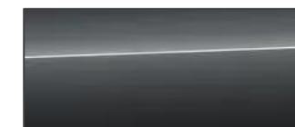
鋼鐵灰 Daytona Grey