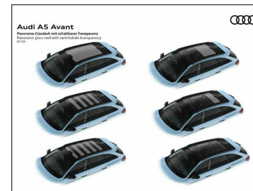
可調光式全景天窗