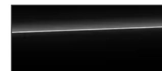
神迷黑 Mythos Black