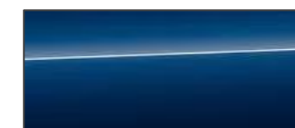
星夜藍 Ascari Blue