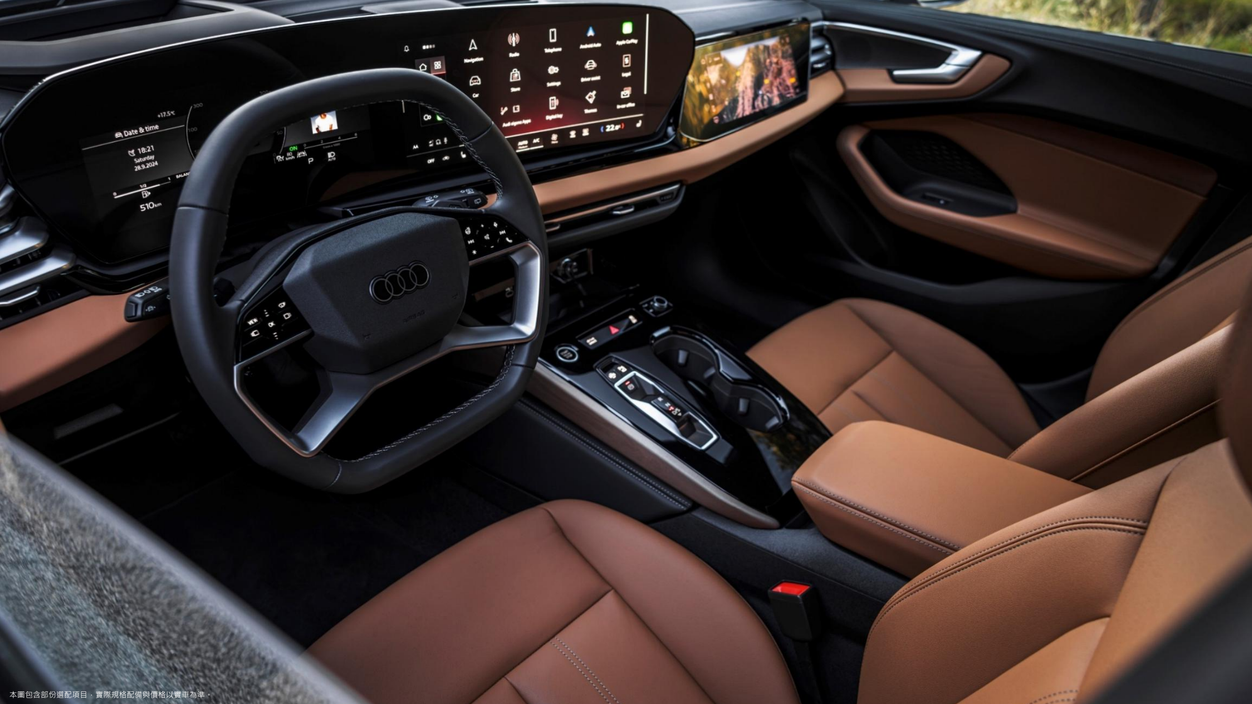
本圖包含部份選配項目，實際規格配備與價格以實車為準。