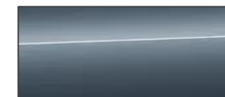
天際藍 Horizon Blue