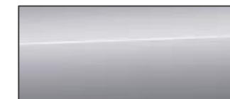
盔甲銀 Floret Silver