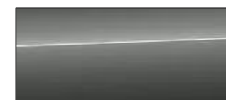
克洛諾斯灰 Chronos Grey