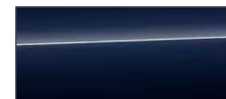
無垠藍 Firmament Blue