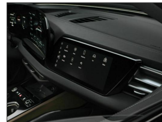
乘客座觸控顯示螢幕